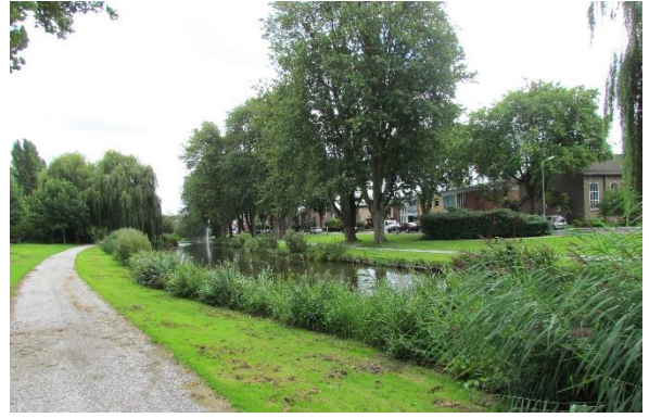
Het eerste park van Zoetermeer, het Wilhelminapark, vlak na de aanleg in 1951 en nu