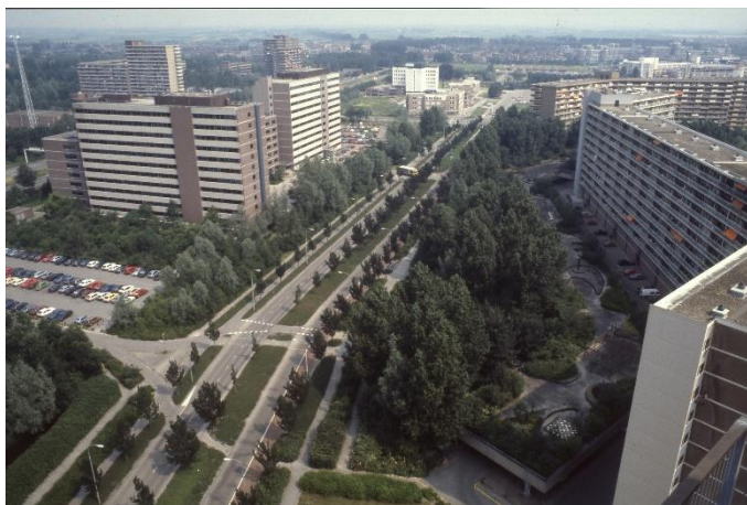
Boerhaavelaan, jaren '80, nu deel van de Entree

Hoort u van grote veranderingen of zelfs sloop van een kenmerkend gebouw dat u waardeert? Stel uw vragen aan de Commissie Historisch Erfgoed (CHE) van Oud Soetermeer (HGOS).