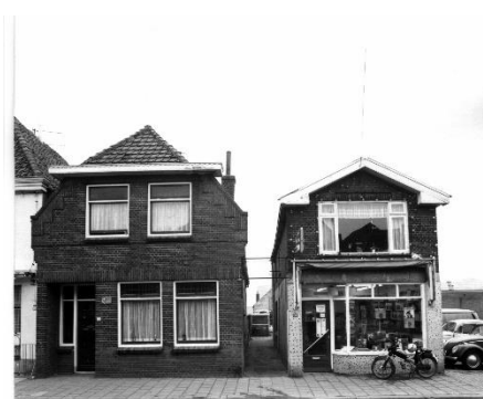
Dorpsstraat 82 en 84 in 1972, nu plannen voor sloop en nieuwbouw