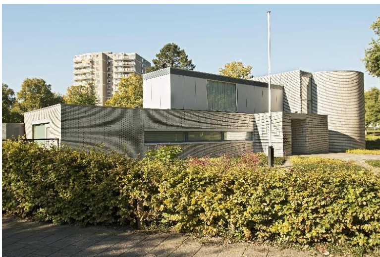
Rietveldvilla aan de Julianalaan

maakbaarheidsgedachten en de geplande stad.