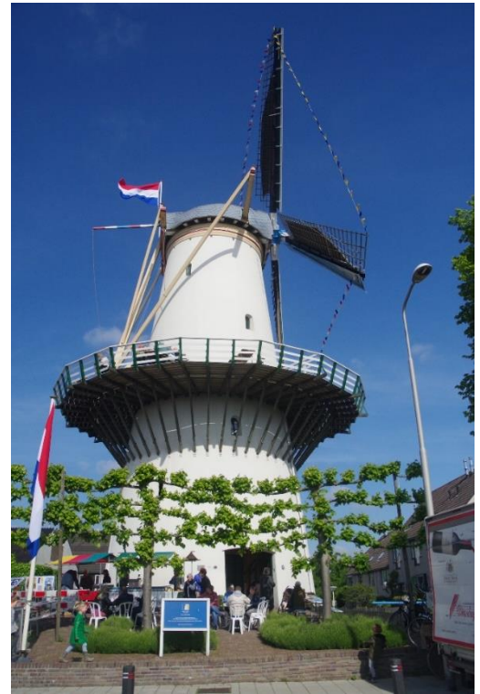
Feestende molen