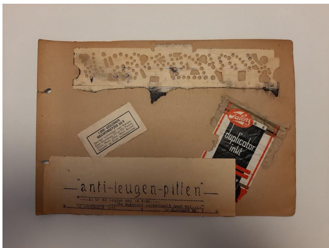
Deel van een stencilvel, drukinktverpakking en de kop van het blad Anti-Leugen-Pillen