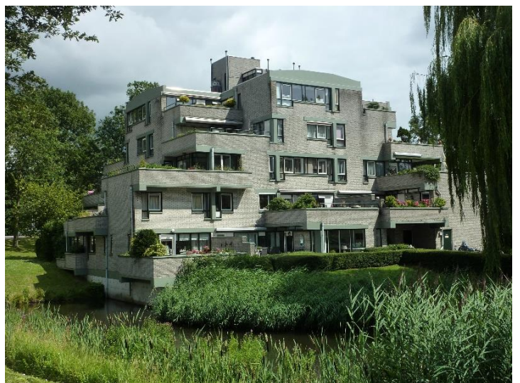
(Douzapad, 'Apenrots')

In het weekend van 13 en 14 september is er weer de jaarlijkse Open Monumentendag. Het grootste deel van het programma vindt op zaterdag plaats. Het thema dit jaar is 'Erfgoed & Architectuur'. De dag zal worden geopend met de onthulling van een historisch informatiebord over de Floriade in Rokkeveen. Locatie: de brug aan het Morapad, zaterdag om 10 uur.