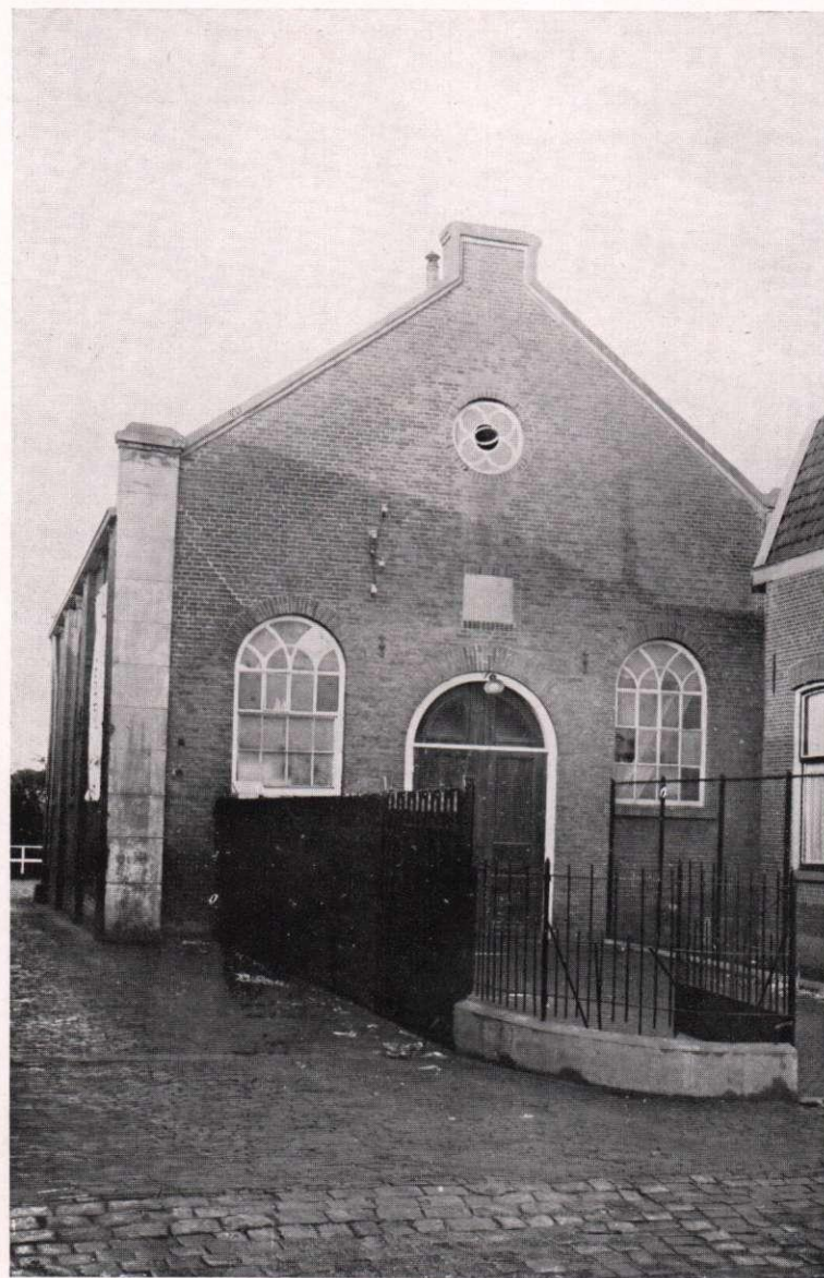
KERKGEBOUW AAN HET LAGE EINDE.

In 1872 is beroepen candidaat Kuiper, op een salaris van